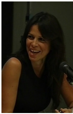
Ξένα Κουβαλάκη: Η «ψυχιατρικοποίηση» της εσβολής

Όλο και συχνότερα διαβάζω στον διεθνή και ελληνικό τύπο εκτιμήσεις ειδικών για την ψυχική κατάσταση του Ρόσου προέδρου Βλαντιμίρ Πούτιν. «Είναι ανασταρτος» αναρροπώνται οι αναλύσεις. Έχει αλλάξει από την τελευταία μας συνάντηση, φέρεται να εκμιστηρεύεται σε στυνούς συνεργάτες του ο Γάλλος πρόεδρος Εμανουέλ Μακρόν. «Είναι πιο τραχιά, πιο απομονωμένος». «Έχω συναντηθεί πολλές φορές μαζί του στο παρελθόν. Κι αυτός είναι ένας διαφορετικός Πούτιν», είπε στο Fox News η Κοντολίζα Ράις, πρώην υπουργός Εξωτερικών των ΗΠΑ. Η παρατεταμένη καραντίνα λόγω κορονοϊού επέτεινε την παρνοία του, έχει αποκτήσει νουοτροπία «μυοίνκερ», λένε ψυχιατροί που μελετούν τη συμπεριφορά του. Στο πλαίσιο αυτής της ποπ ψυχανάλυσης, το μακρύ τραπέζι στο οποίο κάθισε ιδεολογικούς αντιπάλους και ημετέρους θεωρείται μια ακόμη έκφραση του νέου υποχονδρίου εαυτού του. Δεν ξέρω αν άνηθος εζωρηής της πανδημίας τα έργα βγει κάποια ιδιότυπη αρροσομορφία, αλλά στο ζήτημα της Ουκρανίας είναι συνεπής στη δική του λογική, που παραμένει αναλλοίωτη εδώ και μια 15ετία τουλάχιστον. Το 2008 ο Πούτιν είχε πει στον τότε Αμερικανό πρόεδρο Τζορτζ Μπους: «Πρέπει να καταλάβεις, Τζορτζ, Η Ουκρανία δεν είναι καν χώρα». Μόλις πέρισι το καιόκαιρι συνέταξε ένα δοκίμιο 5.000 λέξεων, στο οποίο αμφισβητούσε το δικαίωμα ύπαρξης της Ουκρανίας, επανυλμβανόντας την πάγια πεποίθησή του ότι Ρώσοι και Ουκρανοί είναι ένας λαός.