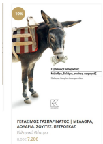
Γεράσιμος Γασπαρινάτος: "ΜΕΛΑΘΡΑ, ΔΟΛΑΡΙΑ, ΣΟΥΙΤΕΣ, ΠΕΤΡΟΚΑΖ"

Το βιβλίο αυτό αφιερώνεται με αγάπη και ευγνωμόνηση στον δάσκαλο και ακοίρτο σκαπανέα του σχολικού/ερασιτεχνικού θεάτρου Στέλιο Παπαπέτρο.